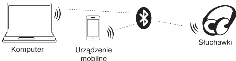
Rys. 2. Schemat połączenia

• Bezprzewodowa transmisja danych za pomocą protokołu Bluetooth pozwala podłączyć słuchawki bezprzewodowo do kompatybilnych urządzeń. Maksymalny zasięg transmisji danych wynosi 10 m. Przeszkody, takie jak ściany, a także inne urządzenia elektroniczne mogą zakłócać transmisję sygnału.